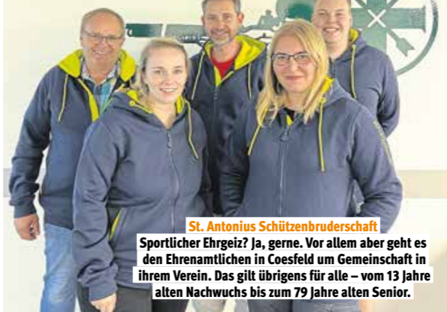
St. Antonius Schützenbruderschaft Sportlicher Ehrgeiz? Ja, gerne. Vor allem aber geht es den Ehrenamtlichen in Coesfeld um Gemeinschaft in ihrem Verein. Das gilt übrigens für alle – vom 13 Jahre alten Nachwuchs bis zum 79 Jahre alten Senior.