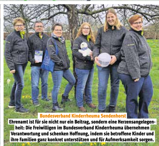
Bundesverband Kinderreuma Sendenhorst

Ihr Einsatz ist buchstäblich lebenswichtig: Die ehrenamtlichen Rettungsschwimmer der DLRG, beispielsweise im Einsatz am Rossenrayer See in Kamp-Lintfort.