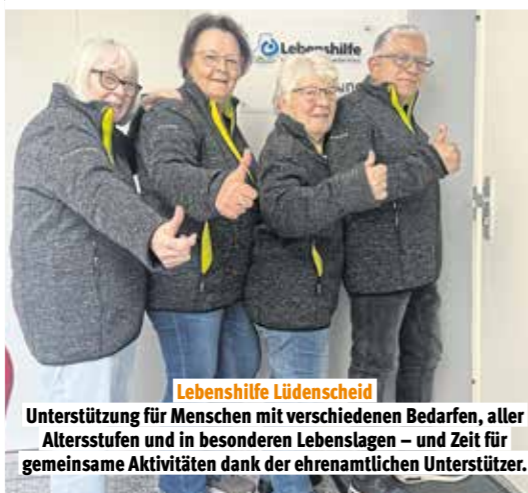
Lebenshilfe Lüdenscheid Unterstützung für Menschen mit verschiedenen Bedarfen, aller Altersstufen und in besonderen Lebenslagen – und Zeit für gemeinsame Aktivitäten dank der ehrenamtlichen Unterstützer.