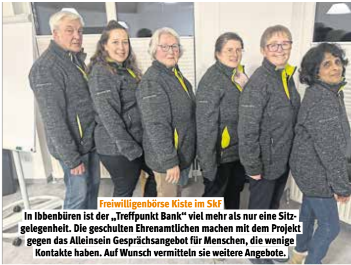
Freiwilligenbörse Kiste im Skf In Ibbenbüren ist der „Treffpunkt Bank“ viel mehr als nur eine Sitzgelegenheit. Die geschulten Ehrenamtlichen machen mit dem Projekt gegen das Alleinsein Gesprächsangebot für Menschen, die wenige Kontakte haben. Auf Wunsch vermitteln sie weitere Angebote.