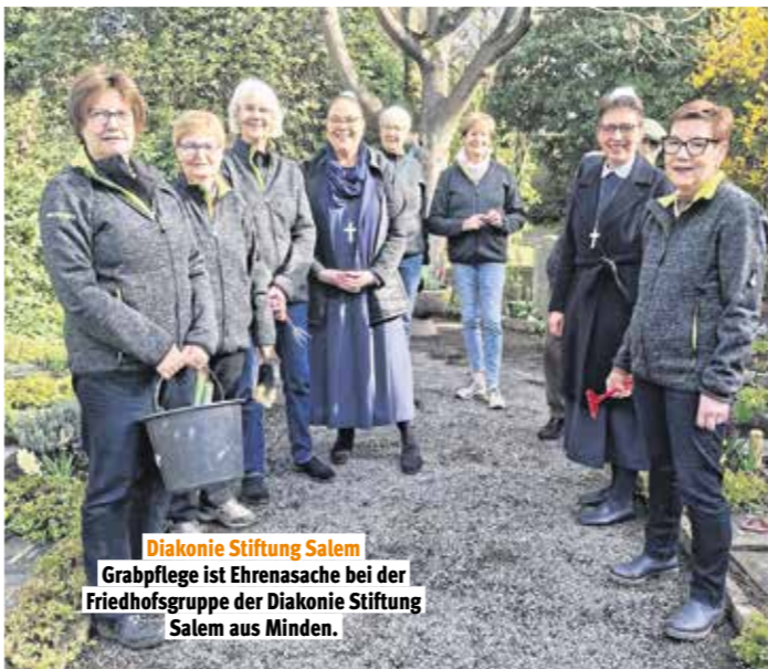
Diakonie Stiftung Salem Grabpflege ist Ehrensache bei der Friedhofsgruppe der Diakonie Stiftung Salem aus Minden.