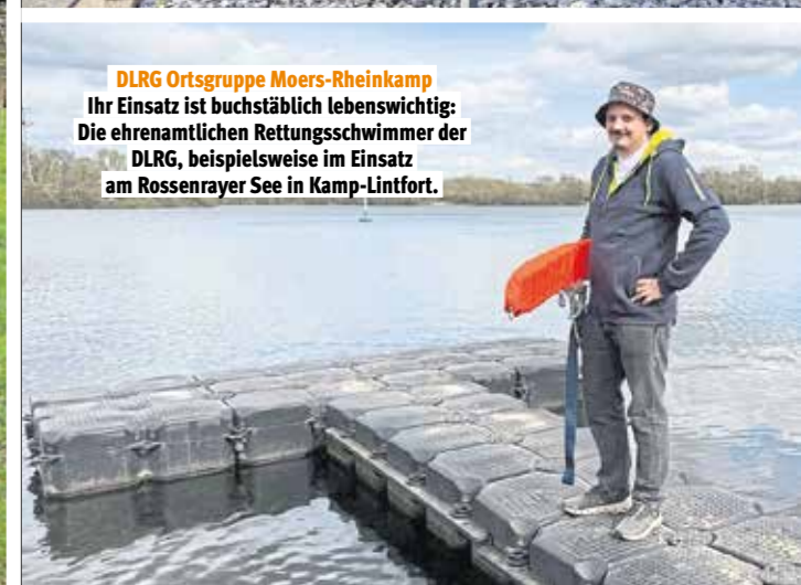
DLRG Ortsgruppe Moers-Rheinkamp

In ihrer Heimatstube dokumentieren sie die Geschichte des Ortes in der Gemeinde Langenberg, in der Gegenwart sorgen die Freiwilligen des Heimatvereins mit vielfältigen Aktivitäten auch für eine lebendige Zukunft.