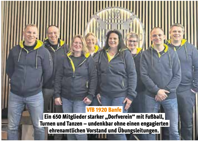
VfB 1920 Banfe Ein 650 Mitglieder starker „Dorfverein“ mit Fußball, Turnen und Tanzen – undenkbar ohne einen engagierten ehrenamtlichen Vorstand und Übungsleitungen.