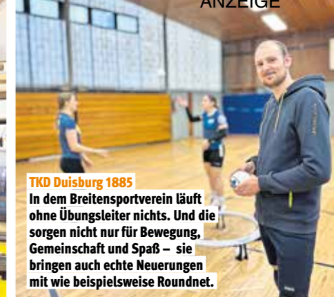
TKD Duisburg 1885 In dem Breitensportverein läuft ohne Übungsleiter nichts. Und die sorgen nicht nur für Bewegung, Gemeinschaft und Spaß – sie bringen auch echte Neuerungen mit wie beispielsweise Roundnet.