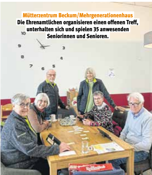
Mütterzentrum Beckum/Mehrgenerationenhaus Die Ehrenamtlichen organisieren einen offenen Treff, unterhalten sich und spielen 35 anwesenden Seniorinnen und Senioren.