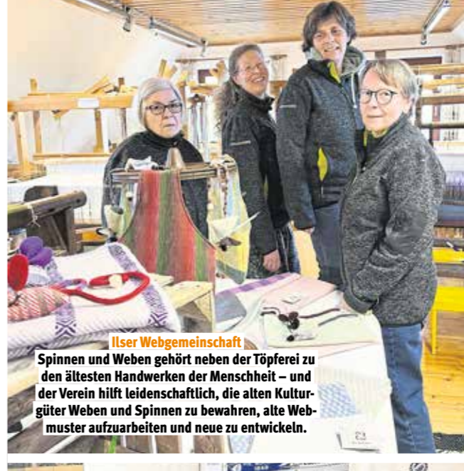
Ilsler Webgemeinschaft Spinnen und Weben gehört neben der Töpferlei zu den ältesten Handwerken der Menschheit – und der Verein hilft leidenschaftlich, die alten Kulturgüter Weben und Spinnen zu bewahren, alte Webmuster aufzuarbeiten und neue zu entwickeln.