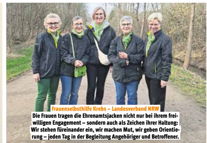
Frauen Selbsthilfe Krebs – Landesverband NRW Die Frauen tragen die Ehrenamtsjacken nicht nur bei ihrem freiwilligen Engagement – sondern auch als Zeichen ihrer Haltung: Wir stehen füreinander ein, wir machen Mut, wir geben Orientierung – jeden Tag in der Begleitung Angehöriger und Betroffener.