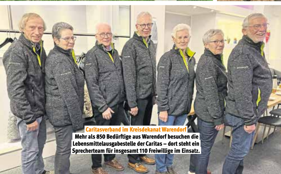
Caritasverband im Kreisdekanat Warendorf

Immer im Einsatz für Westhofen in Schwerte: Der Heimatverein hat 2025 sein 50-jähriges Jubiläum gefeiert und ist aktiv wie eh und je, beispielsweise beim Reinigen eines Kleindenkmals an der Ruhr.