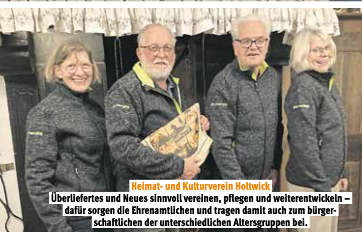
Heimat- und Kulturverein Holtwick

Vom Anfängerschwimmen bis hin zum Leistungssport, von Walken bis Aquafitness – Vielfältigkeit und ein starker Zusammenhalt prägen den kleinen, ehrenamtlich geleiteten Schwimmverein, der mit kontinuierlicher Ausbildung neuer Trainer qualitativ hochwertige Vereinsarbeit sicherstellt.