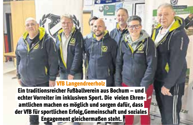
VfB Langendreerholz Ein traditionsreicher Fußballverein aus Bochum – und echter Vorreiter im inklusiven Sport. Die vielen Ehrenamtlichen machen es möglich und sorgen dafür, dass der VfB für sportlichen Erfolg, Gemeinschaft und soziales Engagement gleichermaßen steht.