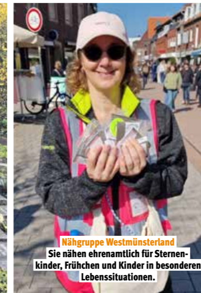
Nähgruppe Westmünsterland Sie nähen ehrenamtlich für Sternenkinder, Frühchen und Kinder in besonderen Lebenssituationen.