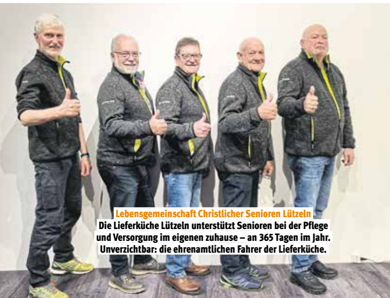
Lebensgemeinschaft Christlicher Senioren Lützel Die Lieferküche Lützel unterstützt Senioren bei der Pflege und Versorgung im eigenen zuhause – an 365 Tagen im Jahr. Unverzichtbar: die ehrenamtlichen Fahrer der Lieferküche.