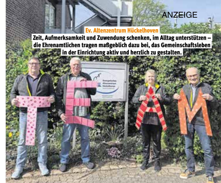
Ev. Altenzentrum Hüchelhoven