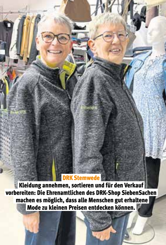
DRK Stewede Kleidung annehmen, sortieren und für den Verkauf vorbereiten: Die Ehrenamtlichen des DRK-Shop SiebenSachen machen es möglich, dass alle Menschen gut erhaltene Mode zu kleinen Preisen entdecken können.