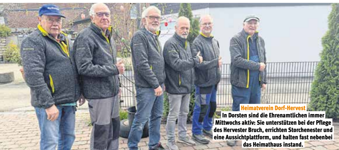
Heimatverein Dorf-Hervest In Dorsten sind die Ehrenamtlichen immer Mittwochs aktiv: Sie unterstützen bei der Pflege des Hervester Bruch, errichten Storchener und eine Aussichtsplattform, und halten fast nebenbei das Heimathaus instand.