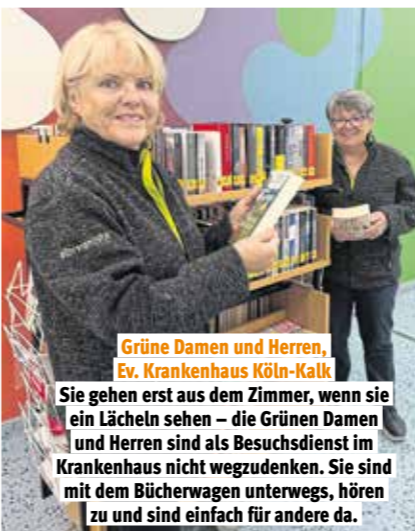
Grüne Damen und Herren, Ev. Krankenhaus Köln-Kalk Sie gehen erst aus dem Zimmer, wenn sie ein Lächeln sehen – die Grünen Damen und Herren sind als Besuchsdienst im Krankenhaus nicht wegzudenken. Sie sind mit dem Bücherwagen unterwegs, hören zu und sind einfach für andere da.