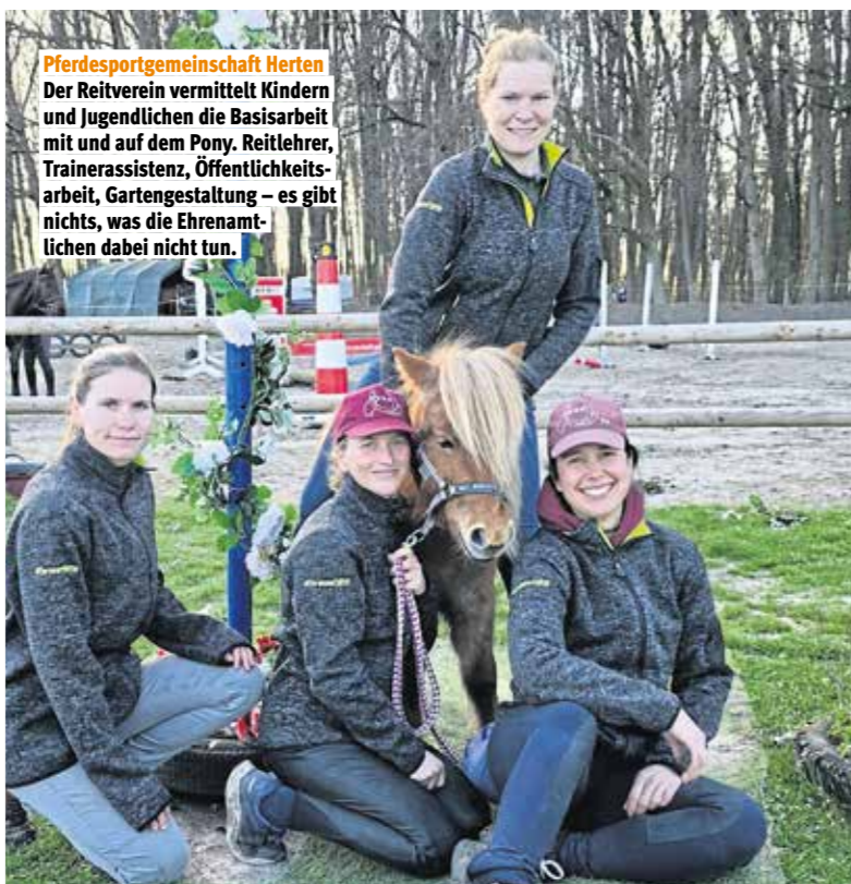
Pferdesportgemeinschaft Herten Der Reitverein vermittelt Kindern und Jugendlichen die Basisarbeit mit und auf dem Pony. Reitlehrer, Trainerassistenten, Öffentlichkeitsarbeit, Gartengestaltung – es gibt nichts, was die Ehrenamtlichen dabei nicht tun.