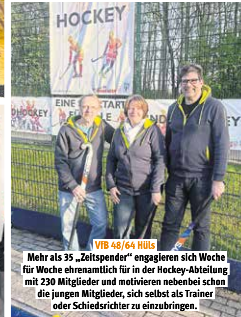
VfB 48/64 Hüls Mehr als 35 „Zeitspendler“ engagieren sich Woche für Woche ehrenamtlich für in der Hockey-Abteilung mit 230 Mitglieder und motivieren nebenbei schon die jungen Mitglieder, sich selbst als Trainer oder Schiedsrichter zu einzubringen.