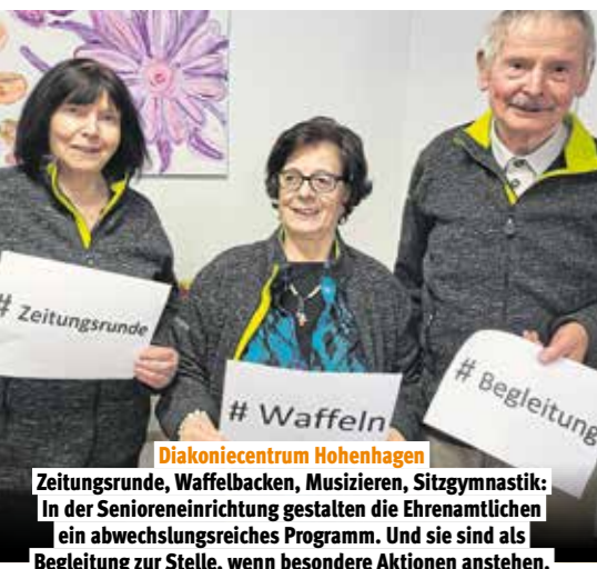
Diakoniezentrum Hohenhagen Zeitungsrunde, Waffelbacken, Musizieren, Sitzgymnastik: In der Senioreneinrichtung gestalten die Ehrenamtlichen ein abwechslungsreiches Programm. Und sie sind als Begleitung zur Stelle, wenn besondere Aktionen anstehen.