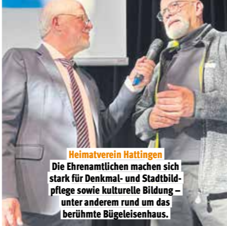
Heimatverein Hattingen Die Ehrenamtlichen machen sich stark für Denkmal- und Stadtbildpflege sowie kulturelle Bildung – unter anderem rund um das berühmte Bügeleisenhaus.