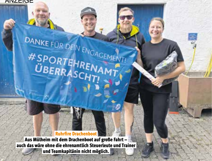
Ruhrfire Drachenboot Aus Mülheim mit dem Drachenboot auf große Fahrt – auch das wäre ohne die ehrenamtlich Steuerleute und Trainer und Teamkapitänin nicht möglich.