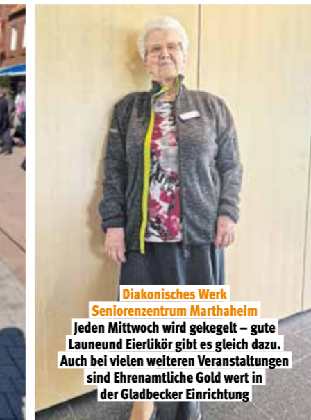
Diakonisches Werk Seniorencentrum Marthaheim Jeden Mittwoch wird gekegelt – gute Laune und Eierlikör gibt es gleich dazu. Auch bei vielen weiteren Veranstaltungen sind Ehrenamtliche Gold wert in der Gladbecker Einrichtung