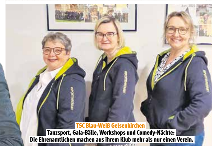
TSC Blau-Weiß Gelsenkirchen

Zeit, Aufmerksamkeit und Zuwendung schenken, im Alltag unterstützen – die Ehrenamtlichen tragen maßgeblich dazu bei, das Gemeinschaftsleben in der Einrichtung aktiv und herzlich zu gestalten.