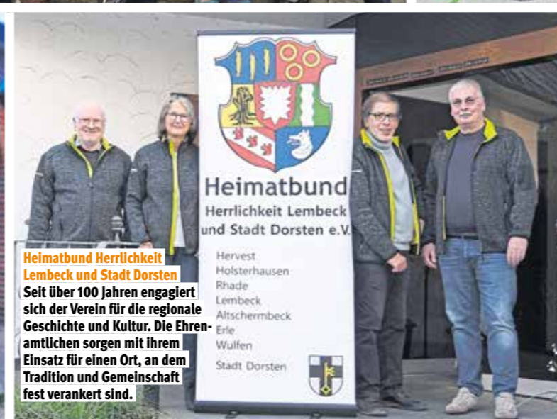
Heimatbund Herrlichkeit Lembeck und Stadt Dorsten

Die Selbsthilfegruppe für Familien mit Kindern mit seltenen Chromosomenanomalien bietet Erfahrungsaustausch und unterstützt beim Umgang mit Tod und Trauer.