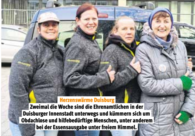
Herzenswärme Duisburg Zweimal die Woche sind die Ehrenamtlichen in der Duisburger Innenstadt unterwegs und kümmern sich um Obdachlose und hilfebedürftige Menschen, unter anderem bei der Essensausgabe unter freiem Himmel.