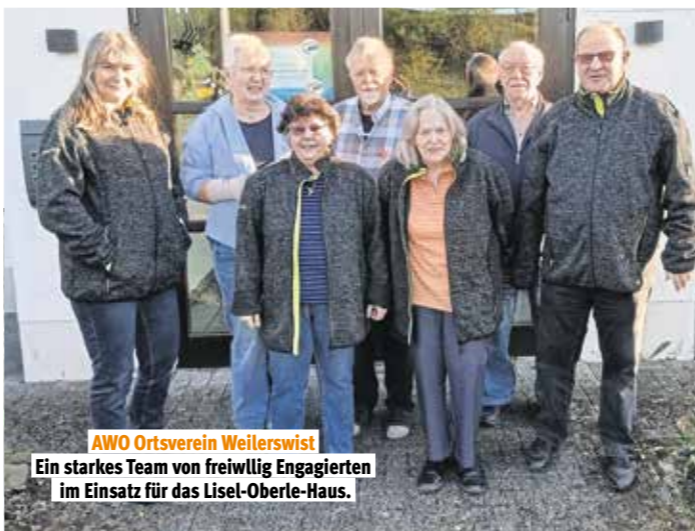
AWO Ortsverein Weilerswist Ein starkes Team von freiwillig Engagierten im Einsatz für das Lisel-Oberle-Haus.