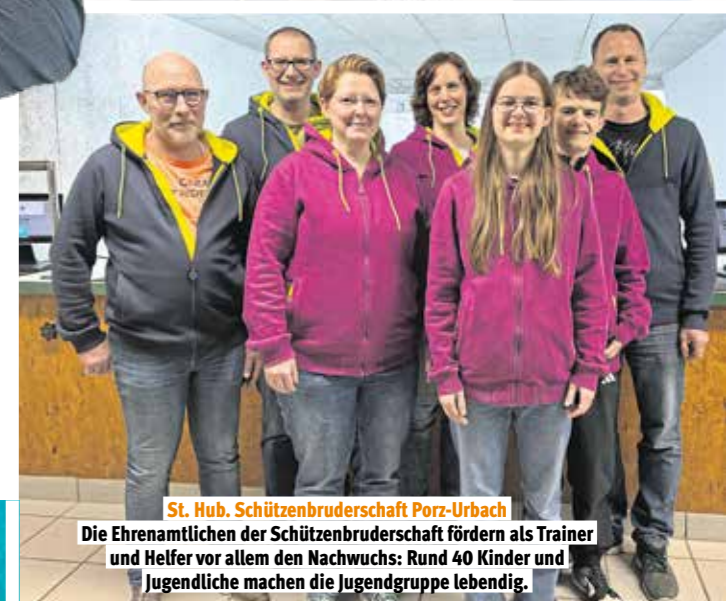
St. Hub. Schützenbruderschaft Porz-Urbach

Tanzsport, Gala-Bälle, Workshops und Comedy-Nächte: Die Ehrenamtlichen machen aus ihrem Klub mehr als nur einen Verein.