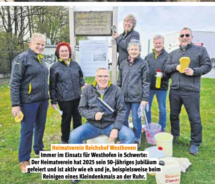
Heimatverein Reichshof Westhoven

Überliefertes und Neues sinnvoll vereinen, pflegen und weiterentwickeln – dafür sorgen die Ehrenamtlichen und tragen damit auch zum bürgerschaftlichen der unterschiedlichen Altersgruppen bei.